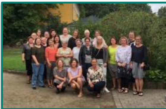
Netværksmøde i Korsør, august 2017