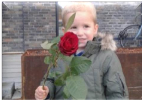
Min far er veteran