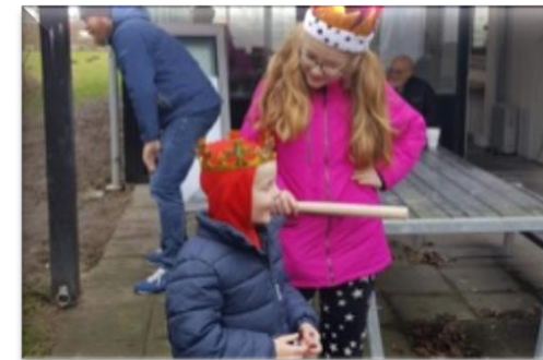
Fastelavn på veteranhjem

Vi deler erfaringer med hinanden om hvor man kan søge hvilken hjælp, og vi bidrager konstruktivt i den offentlige debat om vilkårene for familier hvor far har taget skade af at deltage i krig.